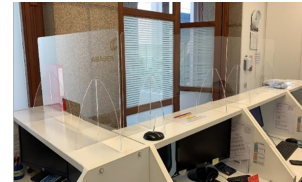
3. Pantalles protectores