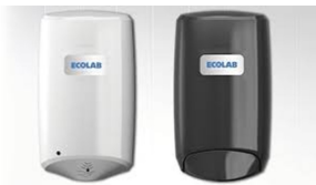
1. Dispensadors sanitaris