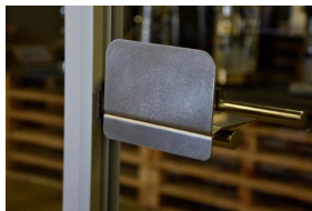
7 . Obertura de portes amb el braç