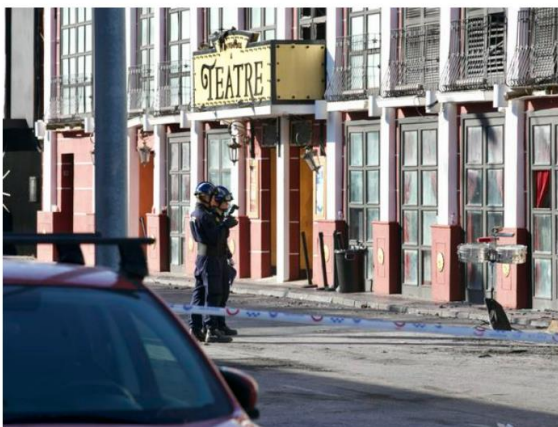
El 'Teatre' tras el incendio.

El Consistorio pone el foco en los técnicos municipales después de que el equipo de gobierno reconociera que los dos locales habían funcionado durante más de un año sin licencia