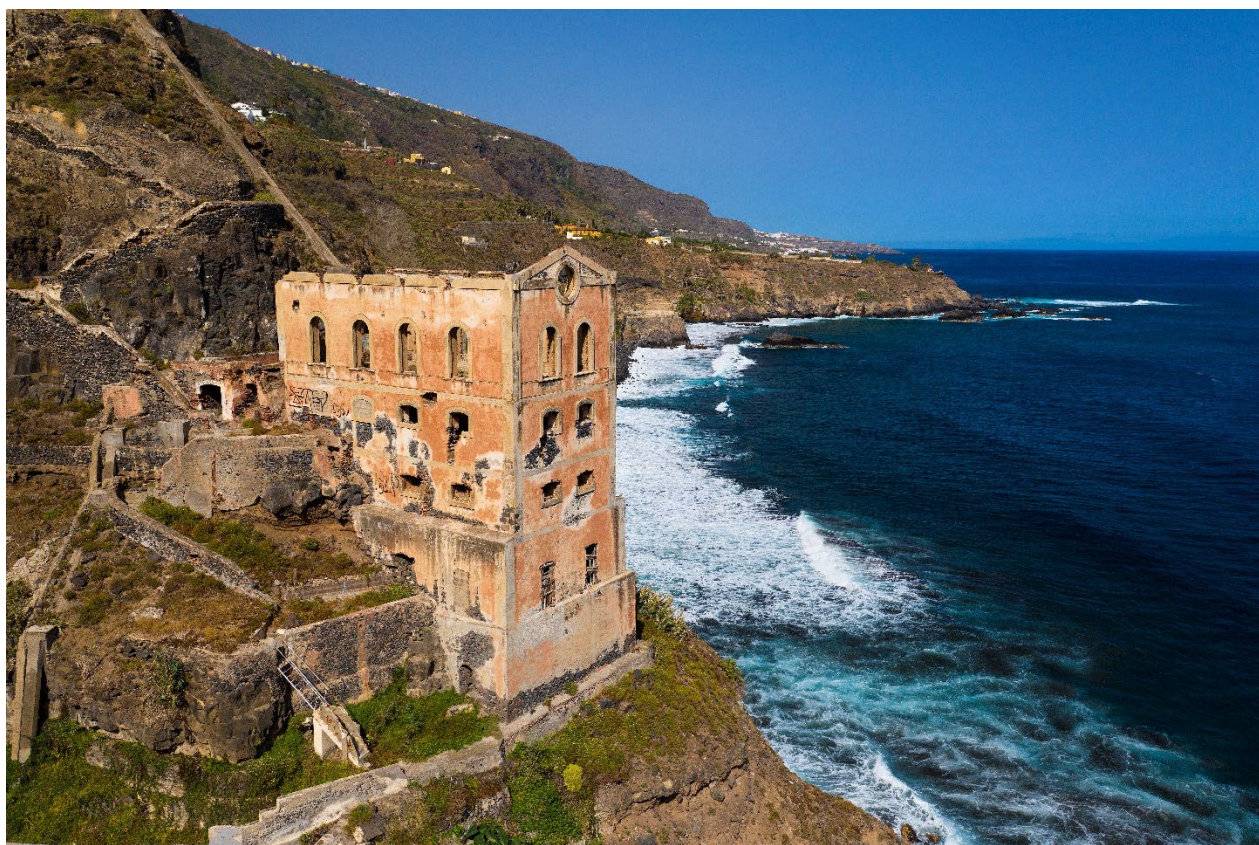
ESTACIÓN DE BOMBEO LA GORDEJUELA (LOS REALEJOS)

El Patrimonio Industrial de las Islas Canarias conforma uno de los conjuntos patrimoniales culturales más desconocidos e infravalorados. Varios han sido los condicionantes que históricamente han condicionado el establecimiento y desarrollo de una actividad industrial sólida: el aislamiento geográfico, la escasez de recursos naturales propios, el peso de la agricultura o la compleja orografía, por citar los más relevantes. En sus comienzos, las islas desarrollaron una industria ligada al comercio internacional, al tabaco, el azúcar, el ron y el tomate. Gracias a estas actividades, entre otras diversas, se instalaron fábricas, talleres, almacenes, cooperativas, compañías exportadoras, etc. que sostuvieron buena parte de la economía insular. En esta charla nos acercaremos a la realidad actual que presentan los bienes que aún se conservan, así como los proyectos y realidades que se han llevado a cabo en los últimos tiempos.