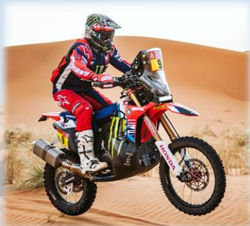
Ricky Brabec (Honda CRF 450 Rally)