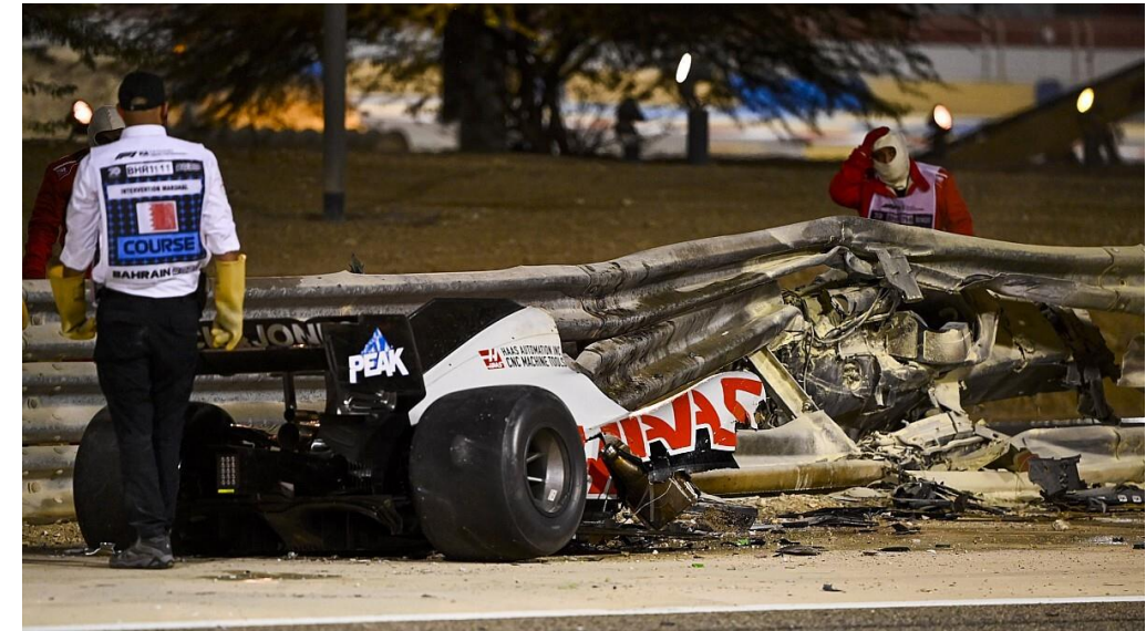
Accident Grosjean, Bahrain (impacte a 67 G's)