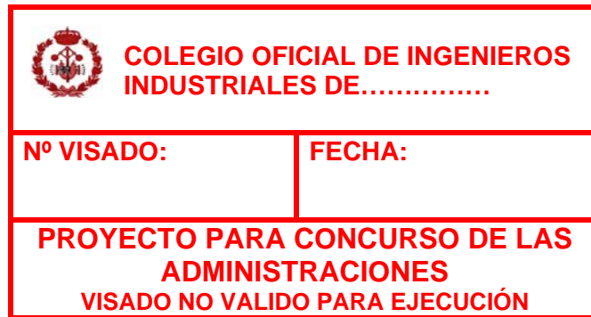
Imagen 5. Contenido mínimo del sello de visado de Proyectos para Concursos de las Administraciones

Una vez adjudicado el concurso, el proyecto se presentará nuevamente para su visado según el presente procedimiento.