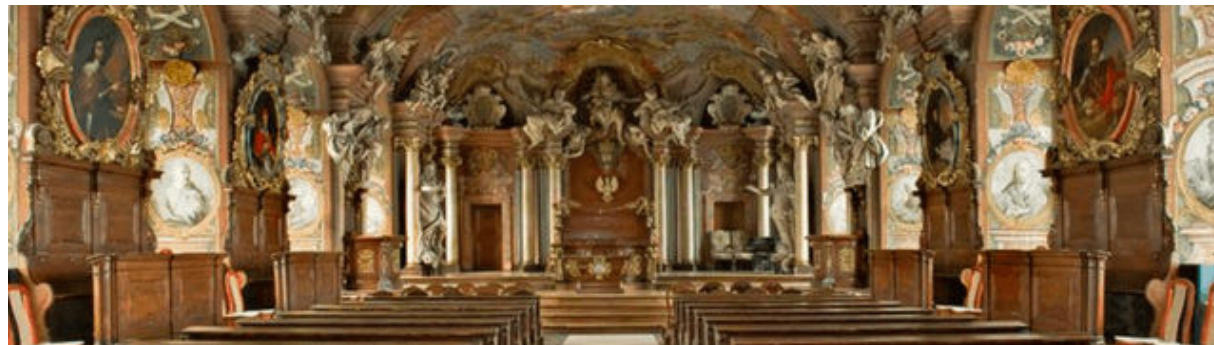
Universitat de Wroklaw