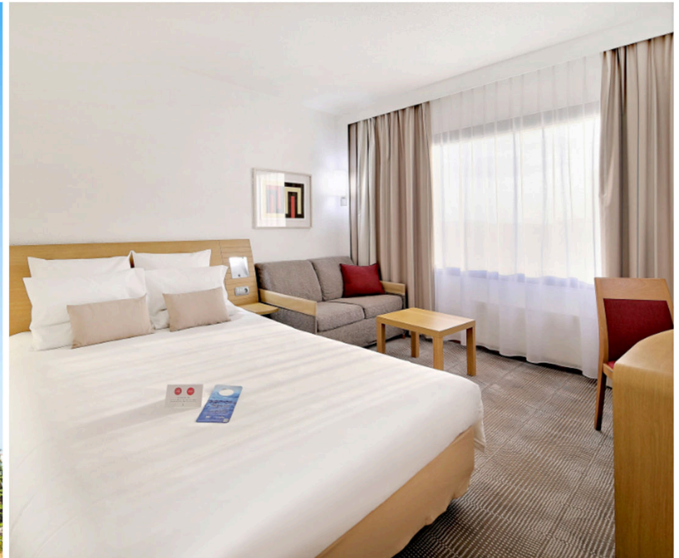
Hotel Novocentrum Katowice