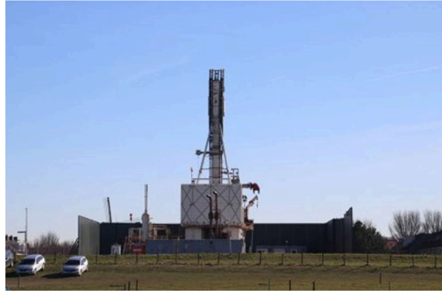
Alt forn a Ruda Slaaska