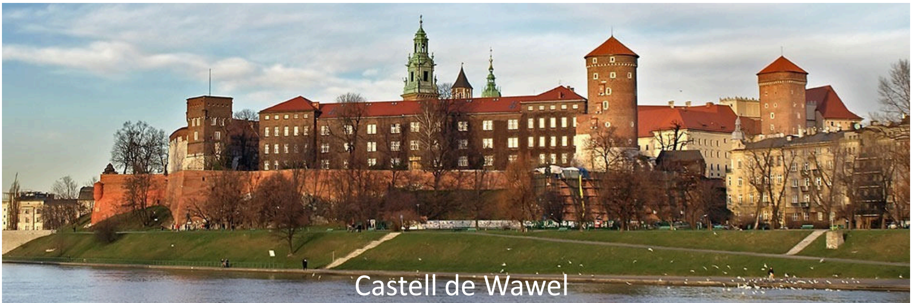
Castell de Wawel