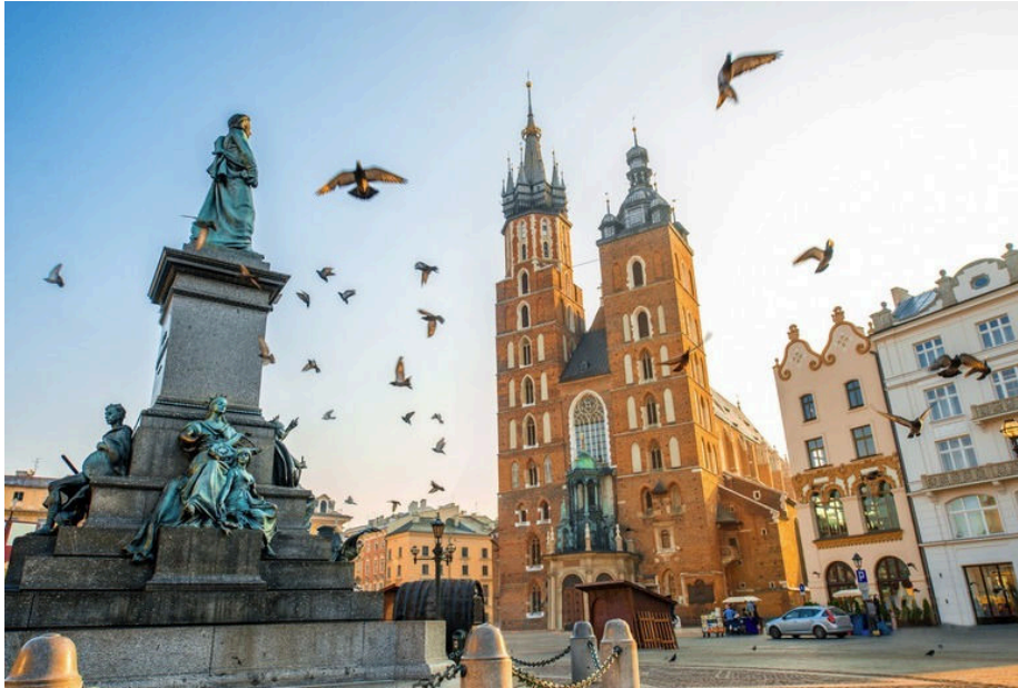
Plaça de Cracòvia