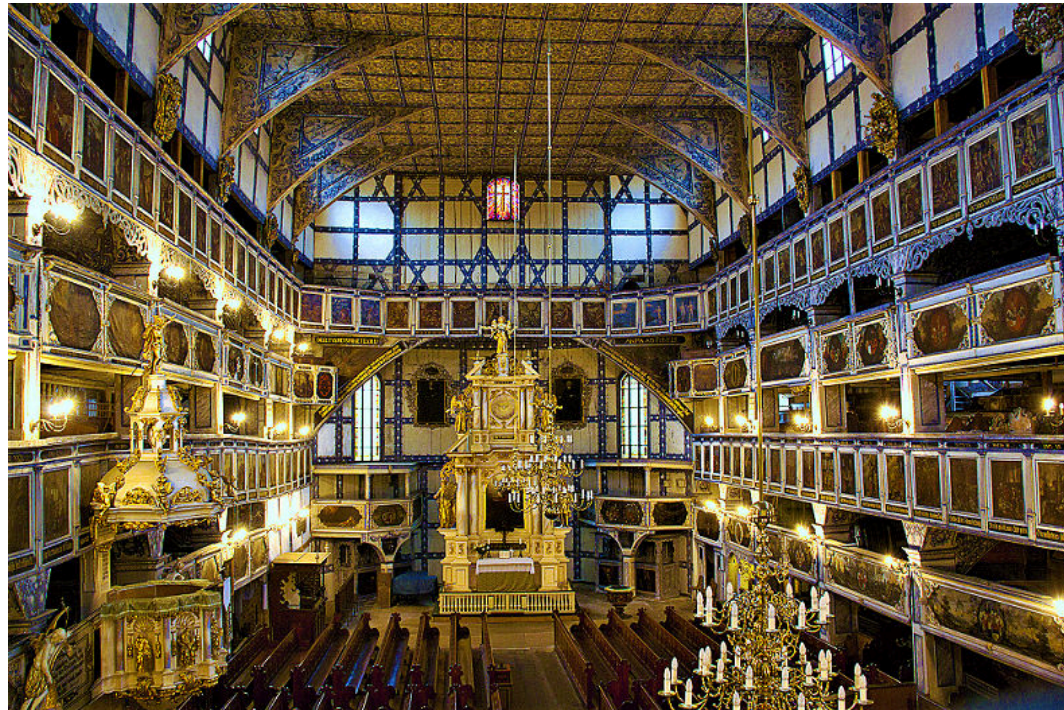
Església sta. Trinidad a Swidnica