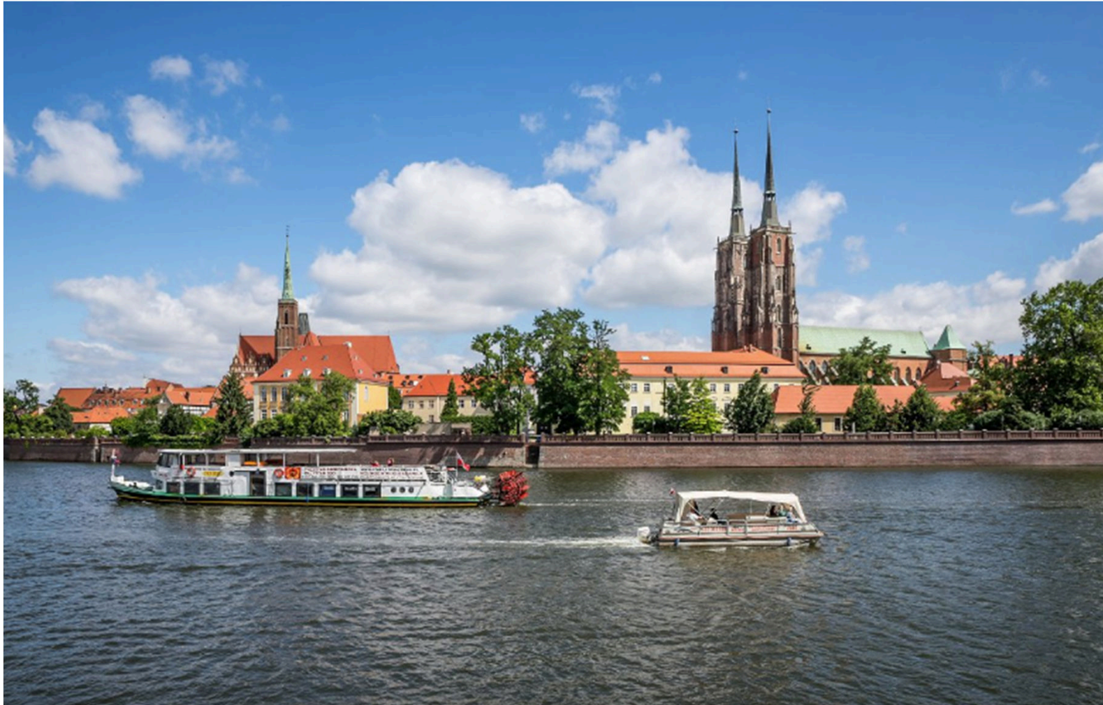
Passejada pel riu Oder