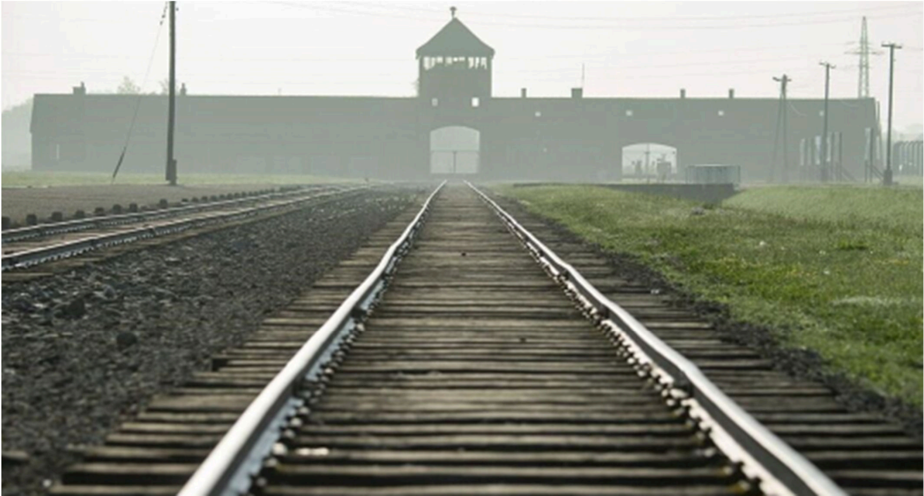
Museu Estatal Auschwitz- Birkenau