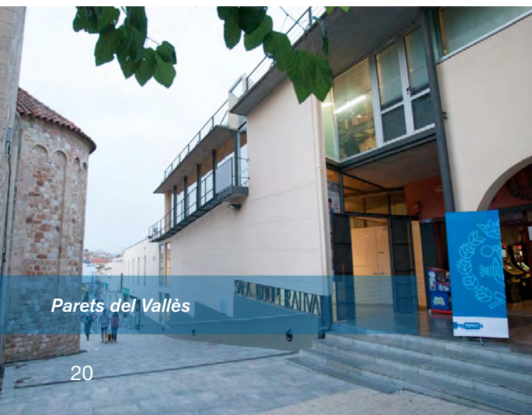
Parets del Vallès

L'Acte Social d'aquest any, el varem dedicar a: