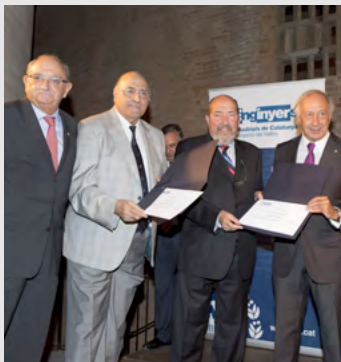
50 anys professió