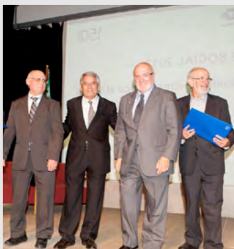
50 anys professió