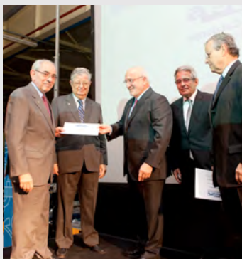
50 anys professió