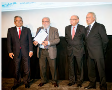
50 anys professió