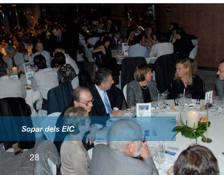
Sopar dels EIC

En aquesta ocasió, l'Acte Social de la Delegació del Vallès el vàrem dedicar a: