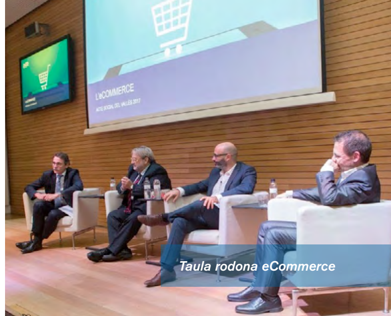
Taula rodona eCommerce