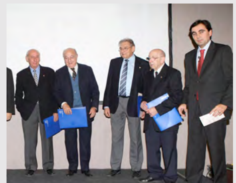
50 anys professió