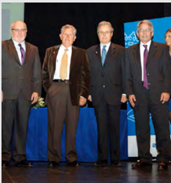
50 anys professió