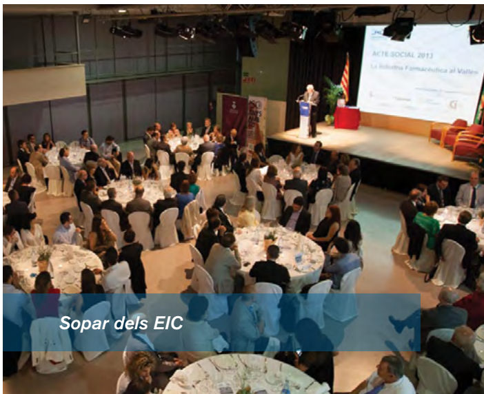
Sopar dels EIC