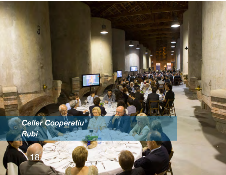
Celler Cooperatiu Rubí