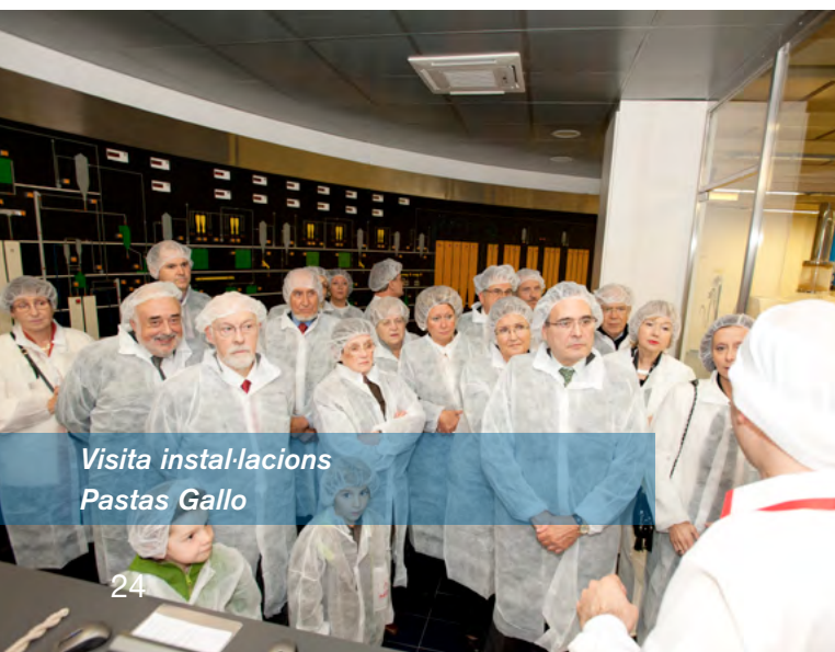
Visita instal·lacions Pastas Gallo

Aquest any, l'Acte Social de la Delegació del Vallès dels Enginyers Industrials de Catalunya, celebrava la seva 15a edició. Seguint el camí encetat els darrers sis anys d'escollir un tema com a element conductor de l'Acte Social, enguany el dediquem a: