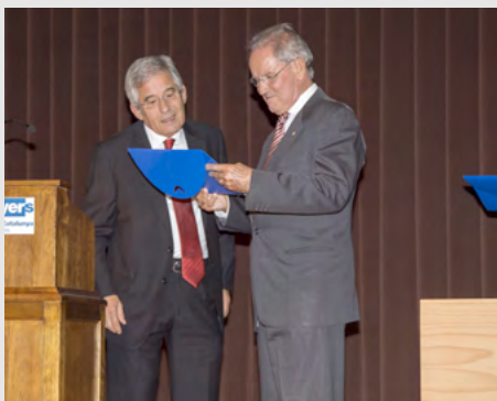
50 anys professió