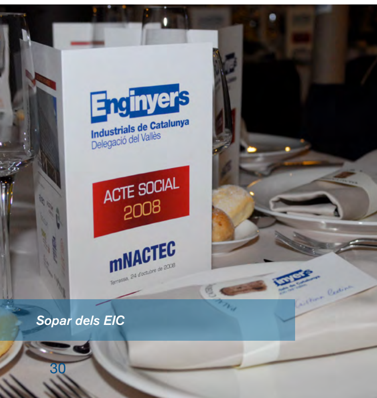
Sopar dels EIC